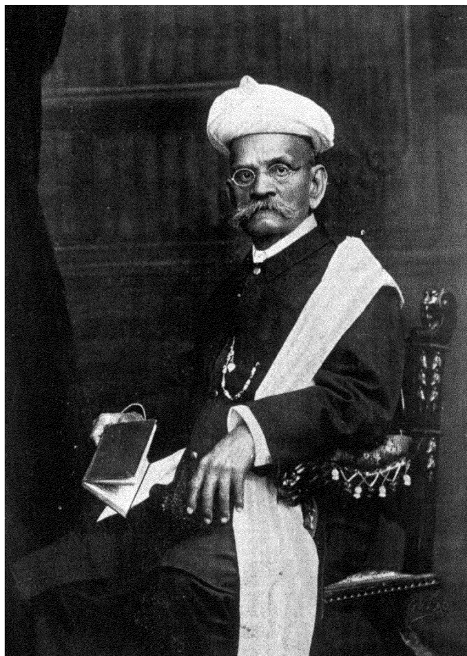
रामकृष्ण गोपाळ भांडारकर